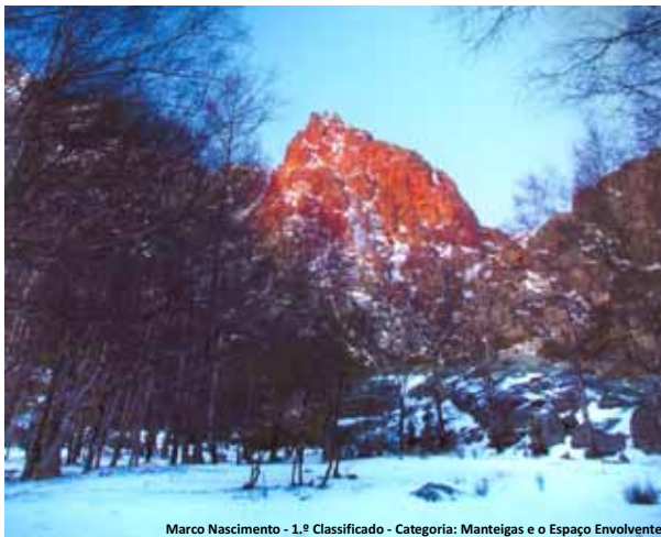
Marco Nascimento - 1.º Classificado - Categoria: Manteigas e o Espaço Envolvente

Município de Manteigas - Câmara Municipal